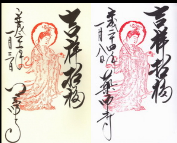
国宝の「吉祥天女画像」が公開されるときのみ授与される、吉祥天女の姿を忠実にかたちどった御朱印です。以上以上の御朱印は、いずれも大講堂内の納経所でいただけます。