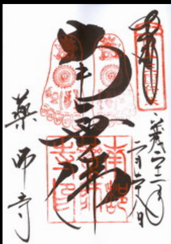
仏足石の御朱印です。