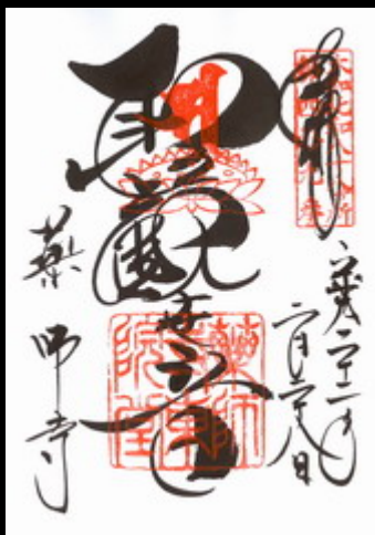
大和北部八十八ヶ所霊場第49番、聖観音菩薩の御朱印です。