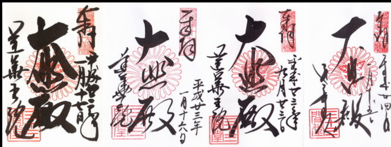
右上の印が変更になっています。以前は「蓮華王院」でしたが現在は「洛陽十七番・蓮華王院」と二行にわたって記されています。