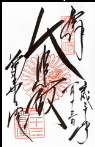
京都府京都市東山区、三十三間堂の御朱印です。