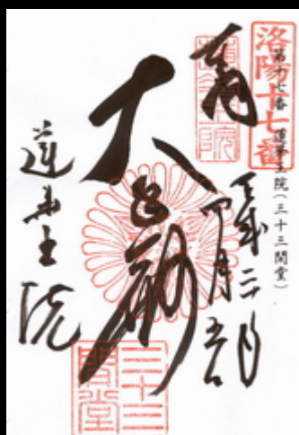
洛陽三十三観音第17番の御朱印です。 御朱印は堂内納経所でいただきました。