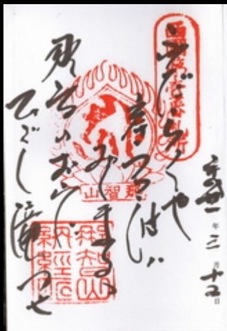
西国1番札所の御詠歌は「ふだらくや 岸うつ波八 みくまのゝ 那智のお山に ひゞく滝つせ」です。御詠歌の御朱印もいただくことができます。