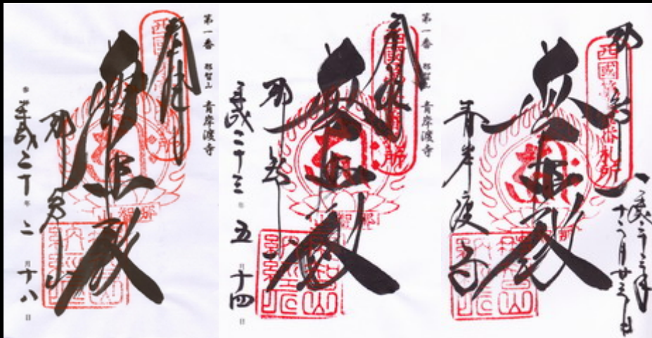
西国三十三所1番札所、和歌山県那智勝浦町にある青岸渡寺の御朱印です。